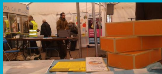
STAND DU FOYER POUR LA JOURNÉE MONDIALE DU REFUS DE LA MISÈRE INITIÉE PAR ATD QUART MONDE